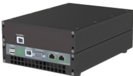
图1：独立版本 - 正面

强大的FPGA； 数据完整性预测(AVETO预处理)； 集群时间同步选项； 支持CAN、以太网和ADAS传感器接口； 优化多千兆重放； 优化用于ADAS开发。