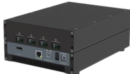
图2：独立版本 - 背面